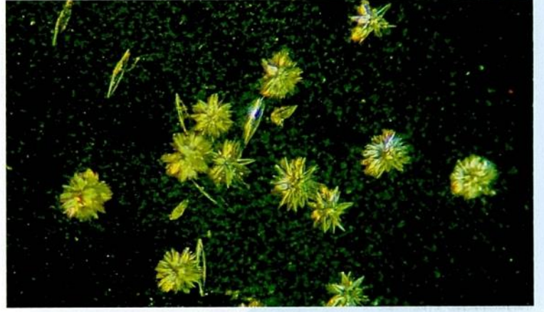
Magnetit mineralinin yüzeyinde biriken tek kiral formdaki RAO kristalleri

Geçmişte yapılan çalışmalarda kozmik ışınların ya da polarize ışığın, yaşamın başlangıcında kiral özellikteki biyolojik moleküllerin bir türünün baskın olmasının sebebi olabileceği düşünülüyordu. Ancak bu mekanizmalar